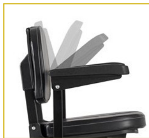
Apoios de braços rebatíveis.