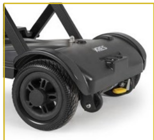
Rodas maciças com antiderrapante.