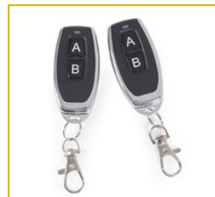
2 comandos incluídos.