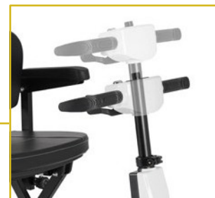
Leme ajustável em altura.