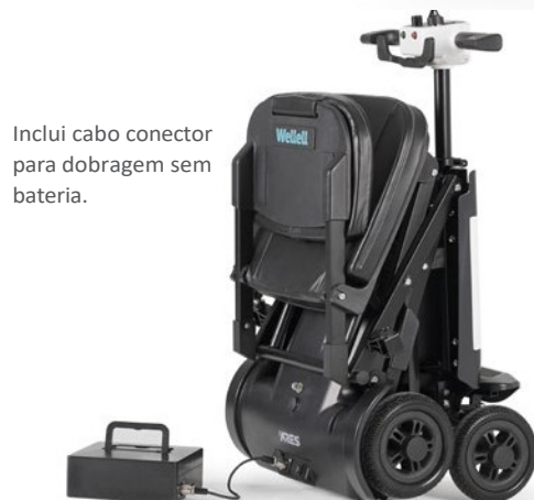
Inclui cabo conector para dobragem sem bateria.