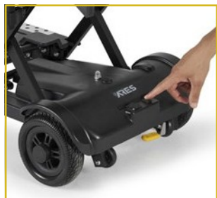
Opção de dobragem eletrónica sem comando.