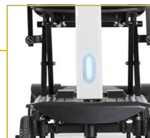
Luz LED dianteira.