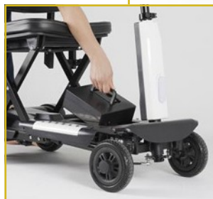
Bateria removível para facilitar o carregamento.