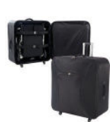
Mala de viagem