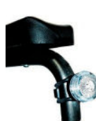
Luz frontal e traseira