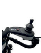
Comando de acompanhante