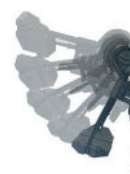
Apoio de pés elevatório