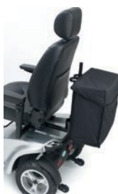
Bolsa traseira com suporte duplo de bengalas