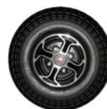
Roda maciça dianteira