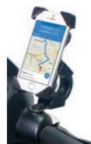
Suporte para telemóvel