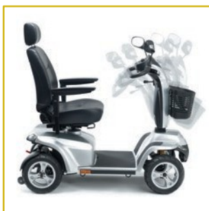
Coluna de condução ajustável