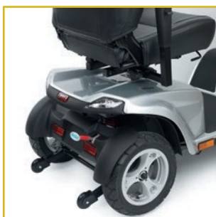
Suspensão traseira. Alavanca de desbloqueio da embraiagem e rodas anti-tombamento.