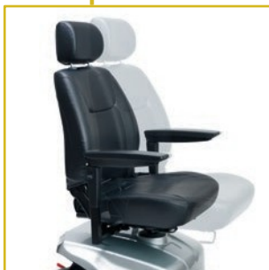
Assento giratório e regulável em profundidade