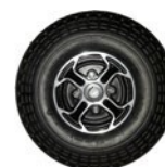
Roda maciça traseira