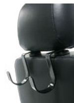
Cabides para sacos