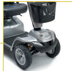
Suspensão dianteira. Com luzes de travão, dianteiras, indicadores e de perigo.