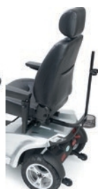
Suporte para bengalas