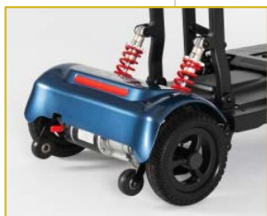
Suspensão traseira com jantes de magnésio