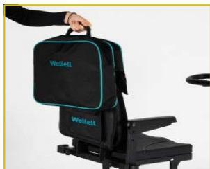
Bolsa traseira incluída de série.