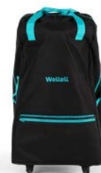
Bolsa de transporte