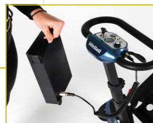
Inclui cabo para dobrar e abrir a estrutura da scooter sem necessidade de montar a bateria no local.