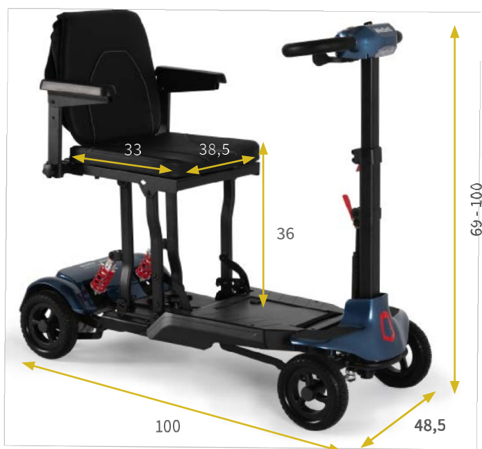
Medidas em cm