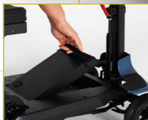
Bateria extraível para carregamento