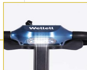
Luz LED frontal