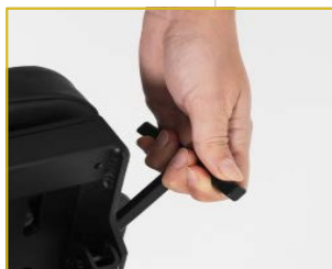
Kit de elevação incluído de série para facilitar o transporte.