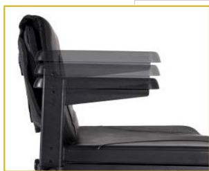
Apoios de braços reguláveis em altura e largura.