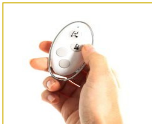
automática com controlo remoto.