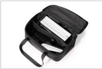
Bolsa de bateria e joystick