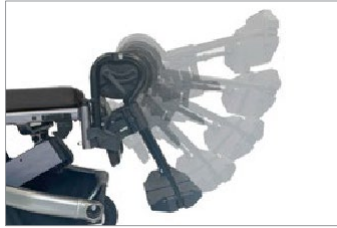
Apoio elevável para os pés