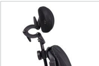
Apoio de cabeça