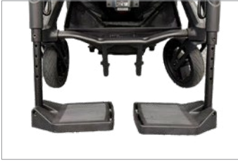
Apoio de pés duplo