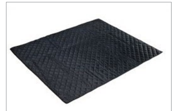
Manta protetora para a mala do carro