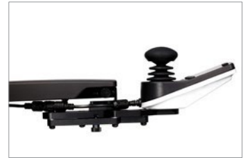
Suporte para Inclinação do Joystick