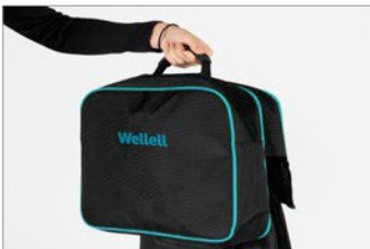
Mala (Válido para o I-Explorer Noa Compact)