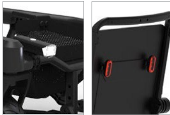
Luz dianteira e traseira