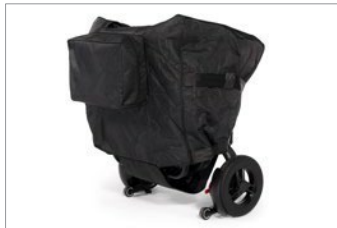
Saco de transporte